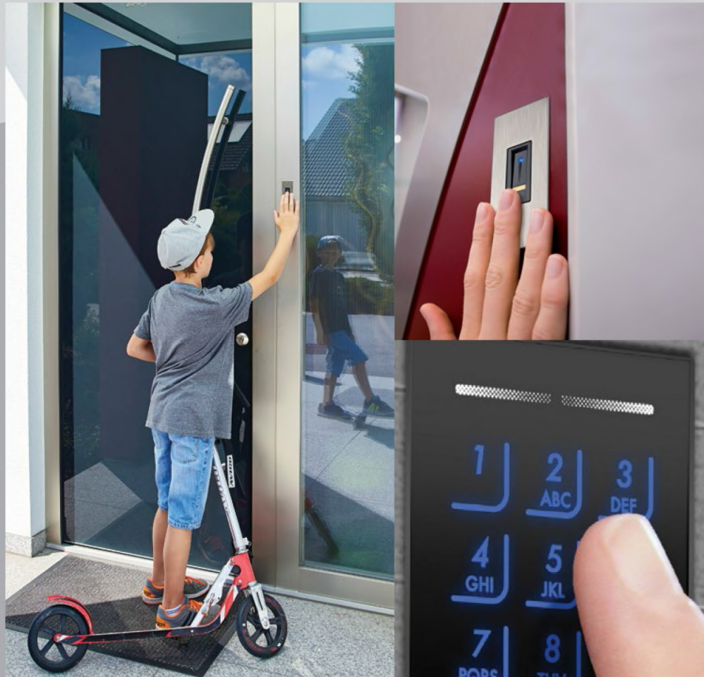
Ekey fingerprint access systems מערכת גישה אלקטרונית