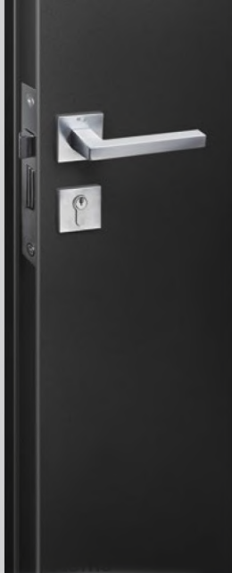
מערכת ידיות Convex Convex Handle Systems