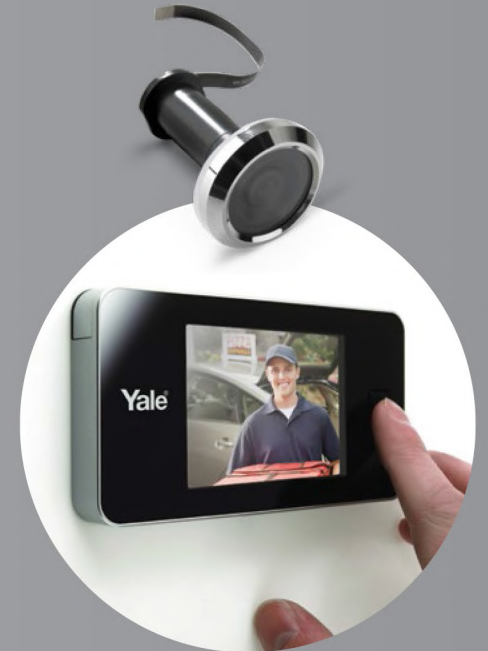
מסך צפייה מבעד הדלת תוצרת YALE Yale Digital Door Viewer